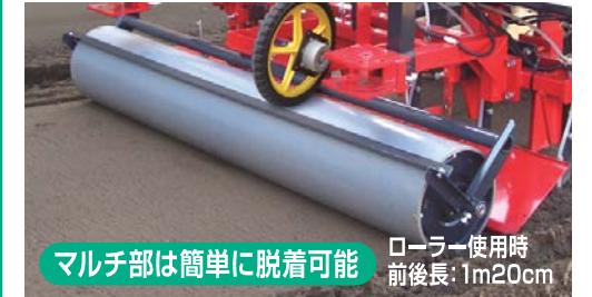
マルチ部は簡単に脱着可能 ローラー使用時 前後長:1m20cm

D-D薬剤など使用する薬剤によりマルチ部品を外して作業できるので1台で2タイプの作業が可能です。(前後長が1.2mと短くハウス作業にも適します)※薬剤の使用基準に従い作業してください。