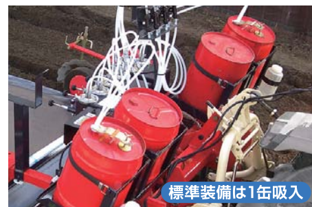
標準装備は1缶吸入