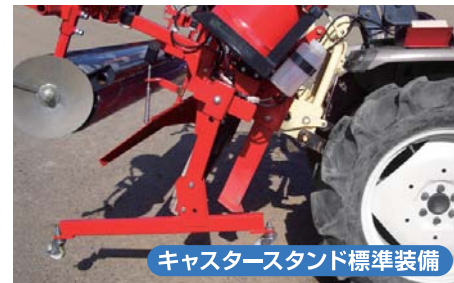
キャスタースタンド標準装備

作業機の装着方法はオートヒッチ装着と標準3P装着の2タイプが可能です。 (写真はオートヒッチ装着)