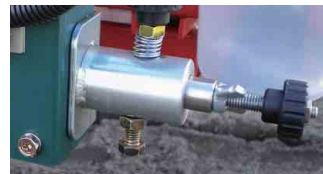
吐出目盛りを微調整/再設定可能