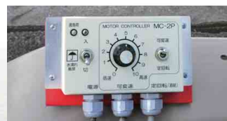
パルス式コントローラ