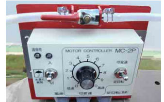
パルス式コントローラ+2方コック