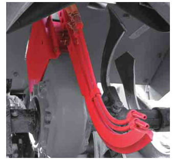
注入ツメ+液ダレ防止バルブ (ノズルはロータリチェーンケースに挟み込み)