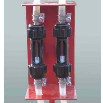
確認計+ホースガイド